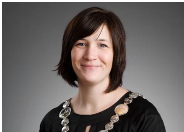
Ordfører Mirjam Ydstebø

Det kan være utfordrende å lage beredskapsplaner, for kriser er vanskelige å forutse. Noen kan være mer sannsynlige enn andre, men de virkelig store krisene har gjennom de senere årene i Norge vist seg å være de mest utenkelige situasjoner. Det er umulig å ta høyde for alt, men bevisstgjøring gjennom beredskapsplanarbeid og øving kan være avgjørende for om kommunen er i stand til å håndtere en krise når den først inntreffer.