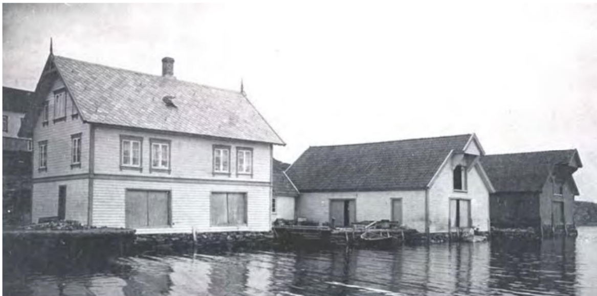
Figur 2. Leiasundveien 173, med originalvindue i Empirestil og ornamentikk i mønet. Kombinert bolig og sjøhus. I sjøhuset til høyre ser man et eksempel på porter i langsiden hvor varer ble lastet inn.

Sjøhustypologien er bevart i Leiasundet. Det er funnet to typer strandsitterboliger 1 . I en type er det bolig i andre etasje og lager for fiske og redskap i første etasje (fig.1). Den andre typen har frittstående bolighus mot veien og sjøhus foran mot sjøen. Den siste variasjonen er i flertall i Leiasundet.