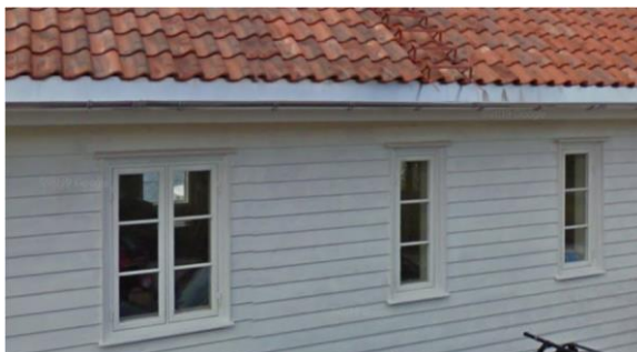
Figur 6. Godt eksempel på nye empirevinduer i hus i Leiasundet.