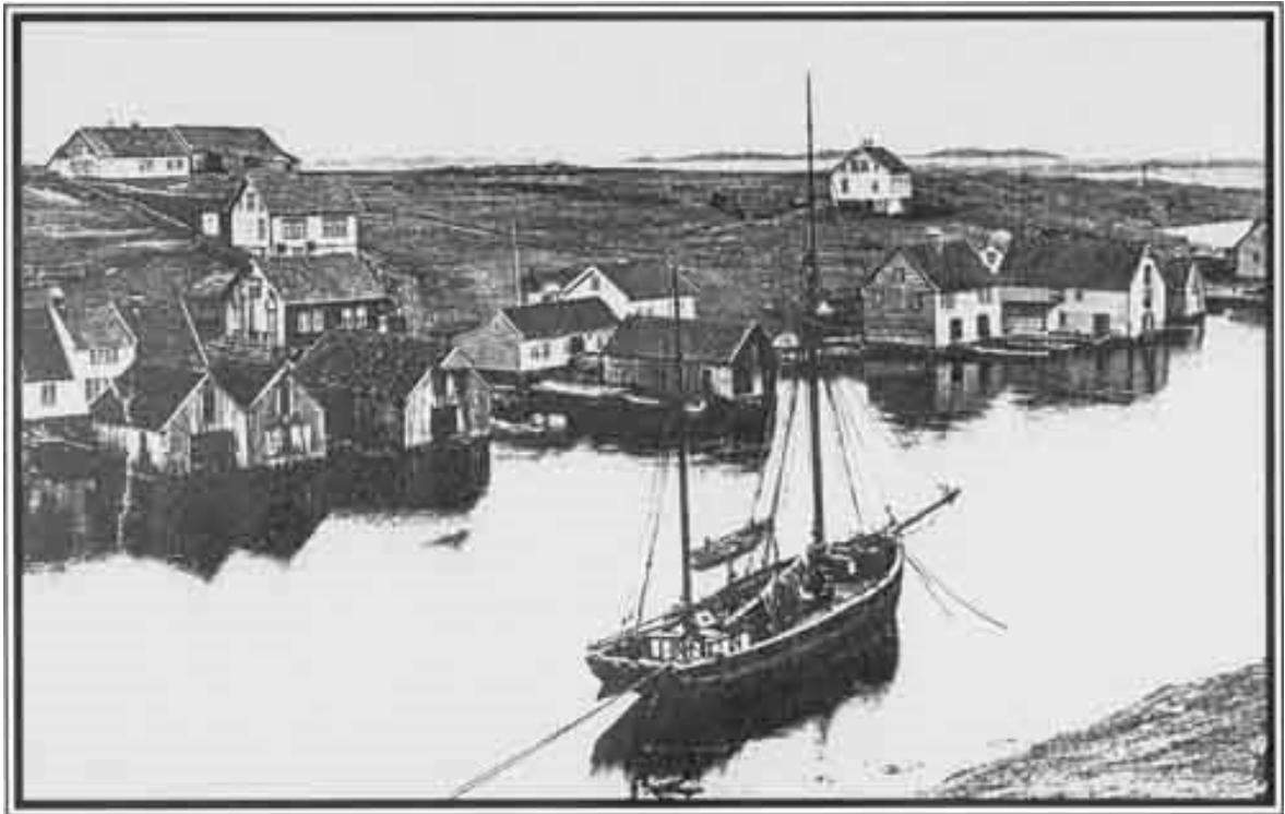
Leiasundet - 1905

rehabilitering og vedlikehold bør utføres slik at bygningsmiljøet bevares og beholder den historiske lesbarheten.