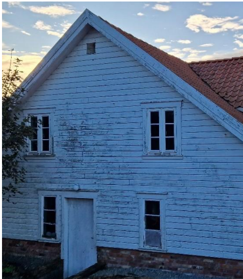
Figur 7. Eksempel på inntrukket dør i fasaden på sjøhus i Leiasundet.

Dersom dører i eksisterende bygninger skiftes ut, bør de tilbakeføres til original versjon hvis den kan dokumenteres. Nye dører med et design som tydelig ikke tilhører bygningstypen eller arkitekturen i området bør ikke brukes.