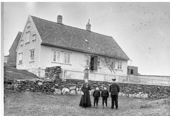
Figur 3. Eksempel på byggestil til bolighus, med empirevinduer, takpanner og uten takutstikk i gavlen. (Ukjent årstall).

Ingen nye eller eksisterende sjøhus kan ha påbygg i form av arker, kvister eller andre takoppløft. Der hvor sjøhus har vindehus, skal disse bevares.