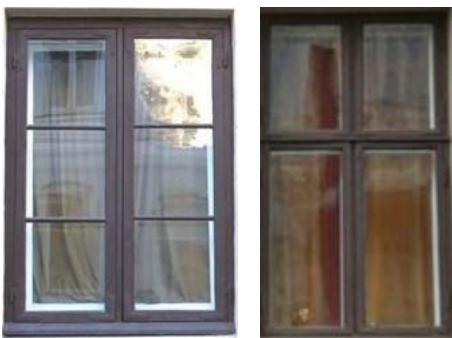
Figur 5. Eksempler på empire- og krysspostvinduer. Vindusveilederen Byantikvaren i Oslo kommune

Der hvor de originale vinduene kan dokumenteres, bør det ved rehabilitering, ombygging o.l. settes inn tilsvarende vinduer i opprinnelig plassering og størrelse. En bør legge merke til vinduenes rammeinndeling der for eksempel losholtene og midtpostene er smale. Belistningen skal være enkel eller tilsvarende opprinnelig belistning. Det bør ikke brukes ekstra ornamentikk utover det som var originalt.