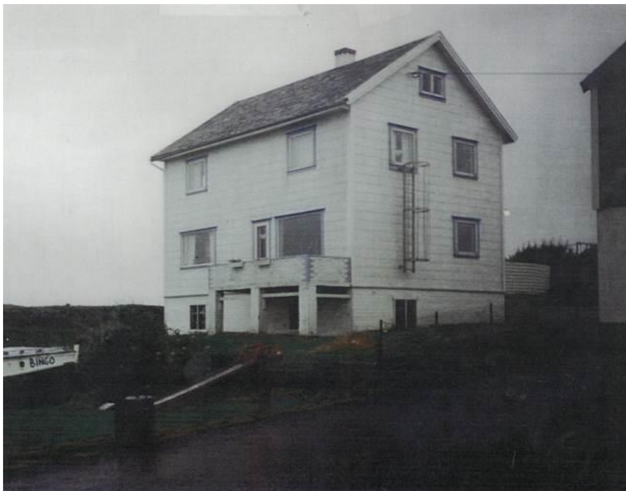
Kvitsøys første barnehage var en enebolig på Meling, med oppstart i 1985.

Siden Kvitsøy er et lite samfunn, kjenner personalet hverandre godt. Mange har nære relasjoner, og siden personalet er stabilt, anser barnehagestyrer arbeidsmiljøet i barnehagen som godt. Det er god stemning på huset, og mye latter høres. Dette smitter over på barna, og de trives godt. I foreldreundersøkelse svarer alle spurte at de vil anbefale barnehagen til andre.